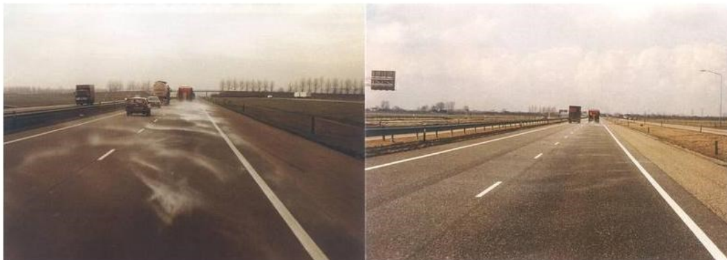
Links: verwaaiing bij droogzout strooien. Rechts: strooibeeld natzoutstrooien.

Een aangereden sneeuw- of ijsmassa is moeilijk te bestrijden. Het vasthechten van sneeuw- en ijs aan het wegdek kan worden voorkomen door preventief te strooien. Hierdoor ontstaat er een soort anti kleeftlaag, waardoor de sneeuw of ijzel niet aan het oppervlak kan hechten en gemakkelijker en dus sneller te verwijderen is en met minder wegeenzout.